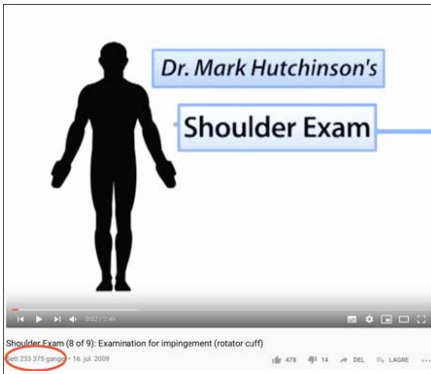
BJSM sine videoer på skulderundersøkelse er sett nesten 250.000 ganger på YouTube

«Vi lærte at vi skulle gjøre en empty-can test og dermed teste supraspinatus. Deretter gikk vi til lunsj. Når vi kom tilbake flyttet vi skulderen inn i fleksjon og gjorde samme motstandstest. Nå testet vi AC-leddet. Hvorfor testet vi ikke lenger supraspinatus i den posisjonen? Var det slik at supraspinatus fikk botoxinjeksjon og var lammet under den testen?»