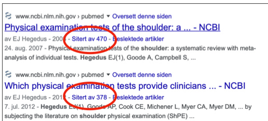
Antall ganger forfatternes publikasjoner om diagnostisk nøyaktighet er sitert

«Hvis testen er positiv og det viser seg at supraspinatus faktisk er røket, er jeg sikker på at det er årsaken til pasientens problem?»