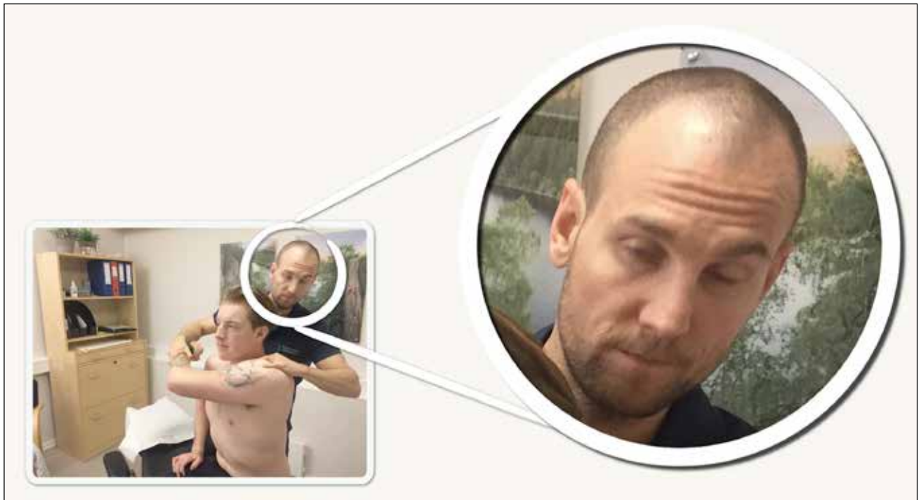
Forfatteren fremstår svært forvirret når han gjør en Cross Body test for AC-leddssmerte

«Hvis testen er positiv, supraspinatus er røket og jeg antar at dette er årsaken til problemet; hva vil det bety for min håndtering av pasienten?»